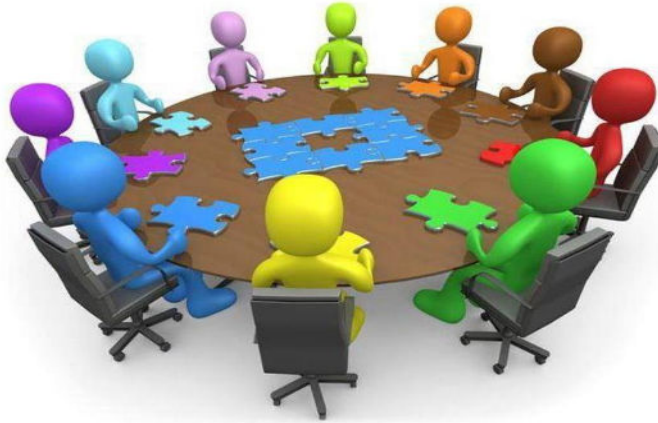
Stratejik Plan Hazırlama Ekibi

Günümüzün bu hızlı değişimleri ile başa çıkabilmek için, geliştirilen yeni yönetim şekillerini her yöneticinin bilmesi gerekir. Kurumlar değişimle başa çıkabilmek için, değişimi yönetmeyi öğrenmelidirler. Çevredeki değişimlere paralel olarak kurumdaki değişimleri gerçekleştirmede en büyük yükü yönetim taşımaktadır. Bütün bu bilgilerin ışığında günümüz dünyasında stratejik planlamanın olmazsa olmaz bir gereklilik olduğunu söyleyebiliriz. Gelişen ve değişen dünyaya uyum sağlayan, geleceği planlayan kurumların ayakta kalacağı gerçeğinden hareketle bu plan, Planlama Ekibi tarafından bütün paydaşların katılımıyla meydana getirilmiştir.